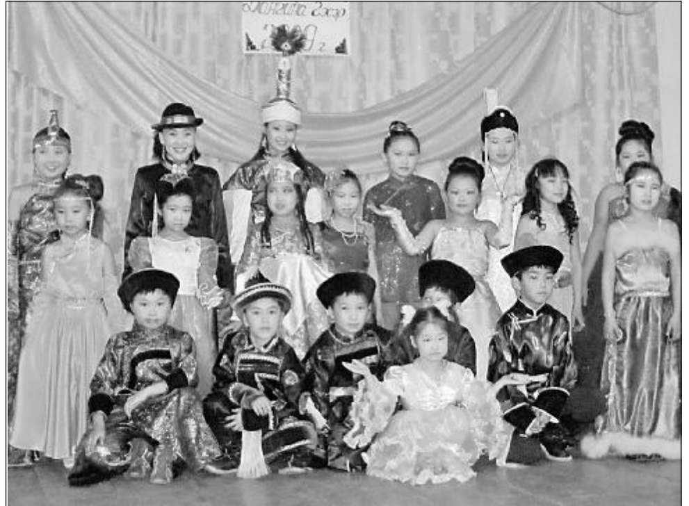
На снимке: участники мероприятия.

Второй год подряд маленькое село Гутаи принимает заключительный тур районного конкурса «Юная Дангина», «Юный Гэсэр» и просто «Дангина» (принцесса Белого месяца). 21 конкурсант из восьми бурятских сел оспаривал высокое звание.