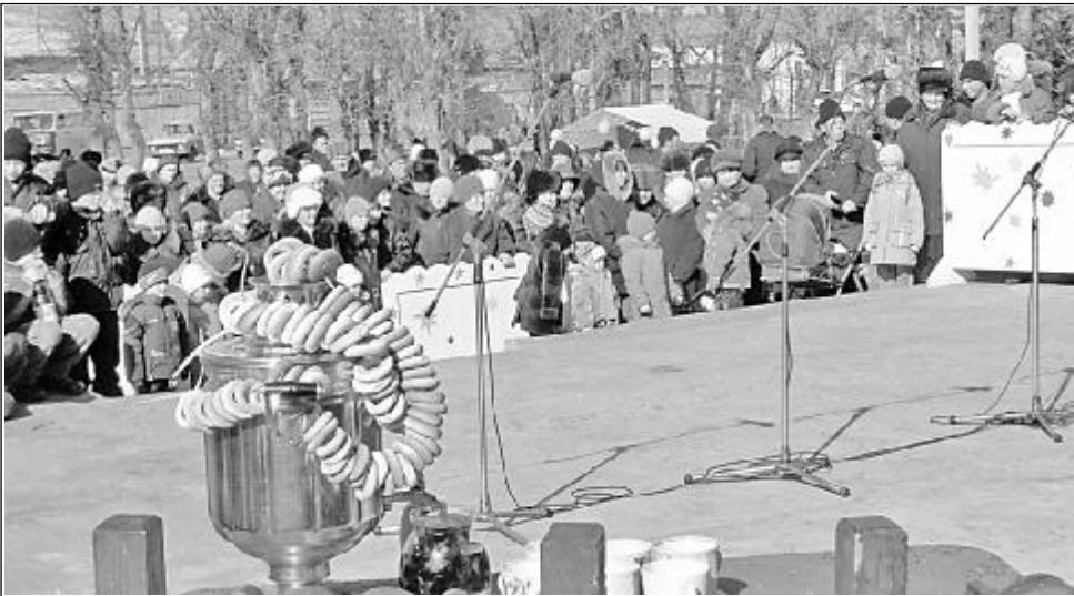
Праздник проводов зимы всегда собирает много зрителей.