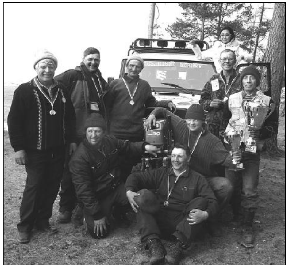
Победители - бичуряне вместе с «бронзовой» командой из Ангарска.