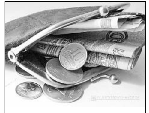
график платежей и получения на руки экземпляра договора с приложениями. Иногда встречаются случаи, когда договора займа с приложениями Заемщику на руки не выдаются. В результате он не знает точные сроки и размеры платежей, допускает просрочки, за которые начисляются неустойки, обычно сильно завышенные пени. Порой размер таких пеней составляет до 1 процента за каждый день просрочки. Бывают случаи, когда размер начисленных пеней может составлять больше чем сам размер займа, который вы брали.

Заемщику следует получить денежные средства у Заимодавца, только после подписания сторонами всех документов, относящихся к договору и особенно