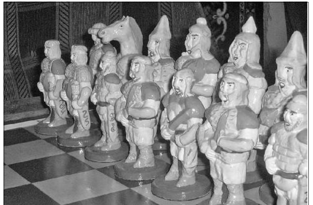
На фото О. Левушкина шахматные фигурки из глины, сделанные автором.