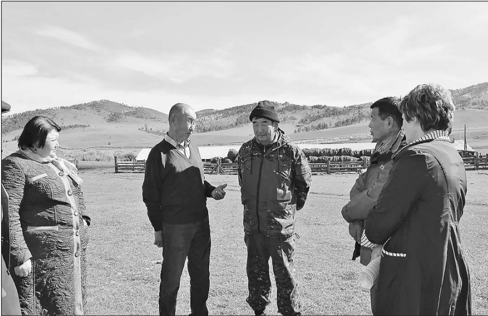
КФХ Ж.Ц. Цыренова организовано в 1992 году