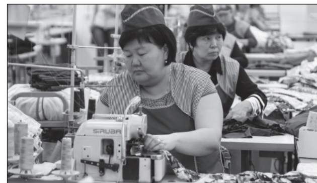
Предприятие «Ажур-Текс» — один из резидентов Промышленного парка.

Полоса подготовлена при информационной поддержке Правительства РБ