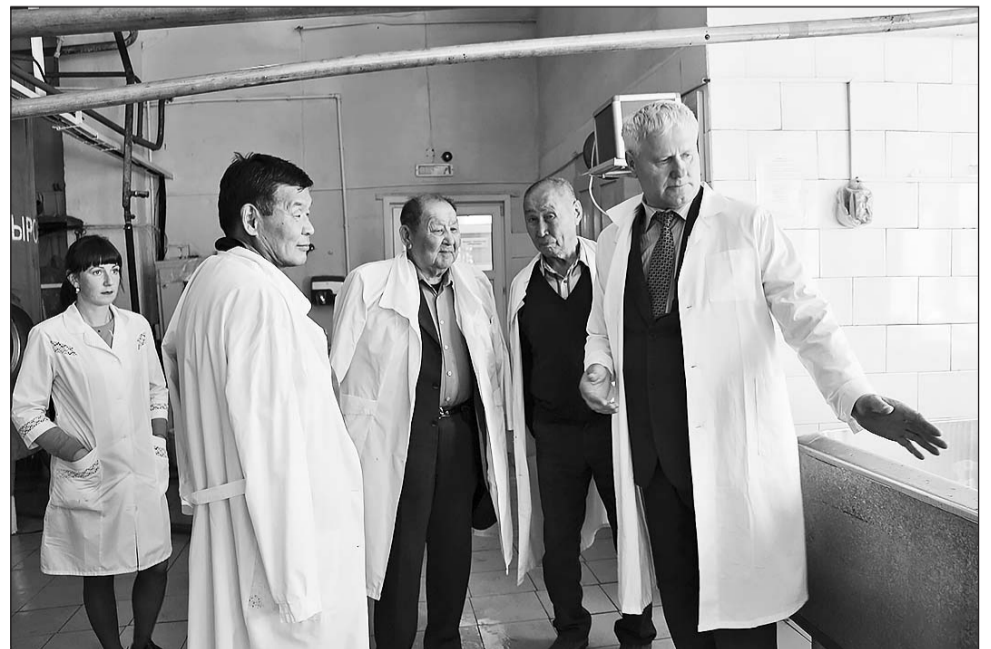
На Бичурском маслозаводе