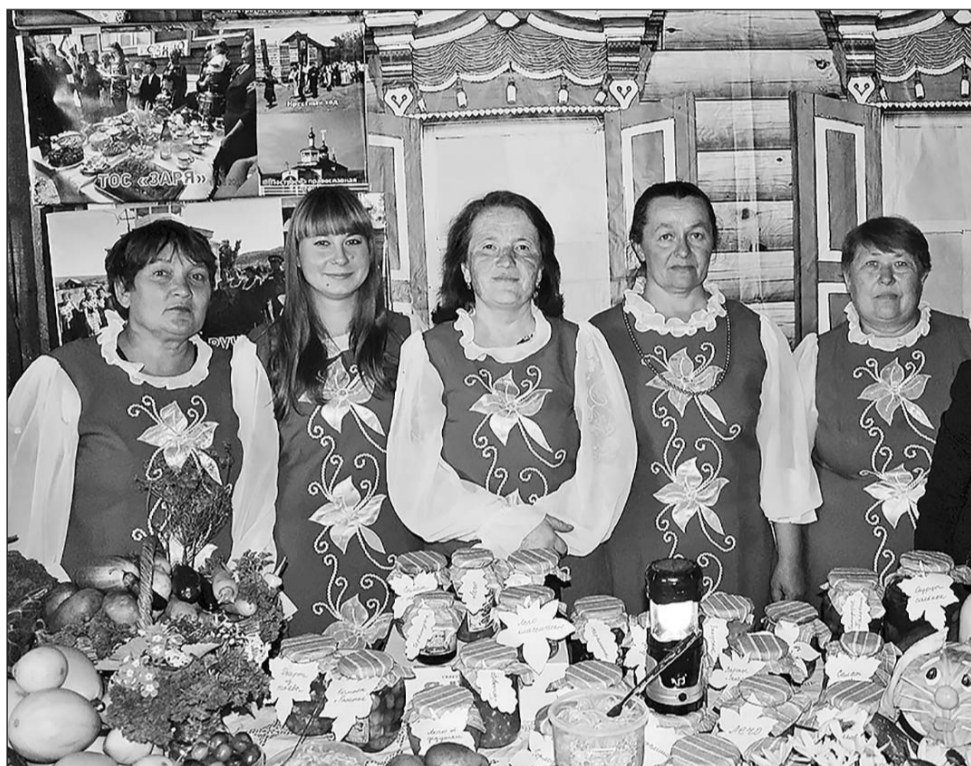
Участники выставки из МО СП «Дунда-Киретское» приветливо встречали посетителей

Приз от районного Совета депутатов получила команда Бичурского центра помощи