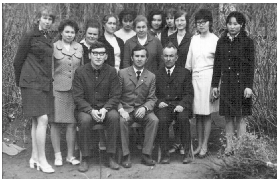
Коллектив Гочитской школы. 1975 г.