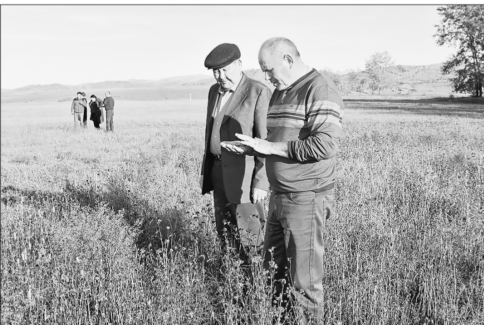
Прогноз урожая гречихи не оправдался