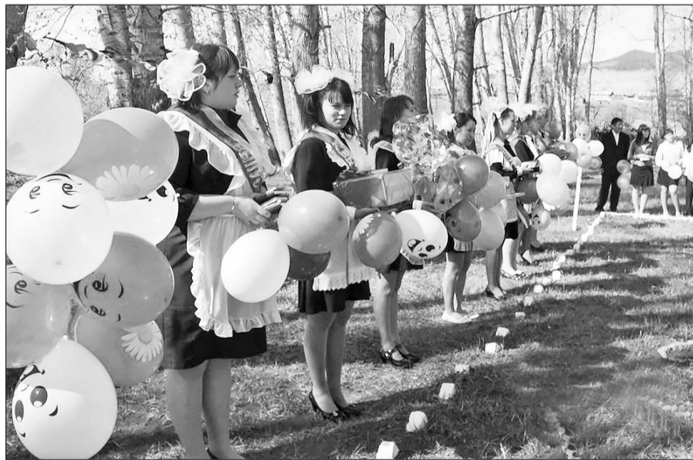
Последний звонок 2007 г.