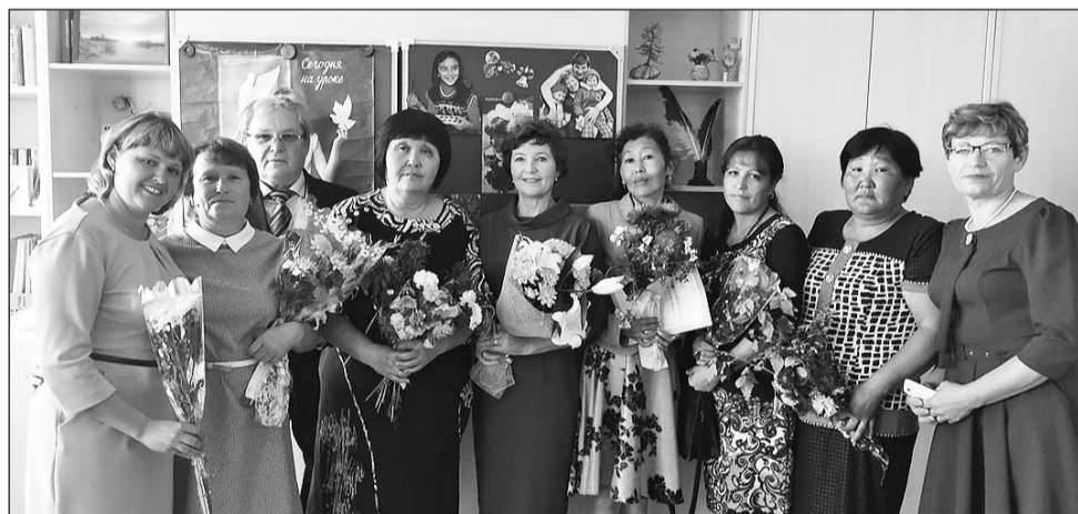
Коллектив Гочитской школы. 1 сентября 2017 г.