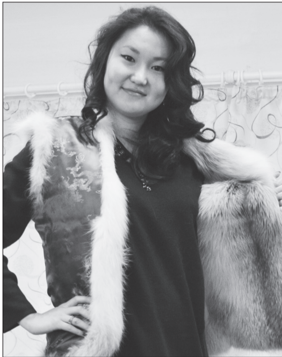
Господдержка позволила ООО «МИП «ЭКОМ» создать полный цикл по переработке овчины.