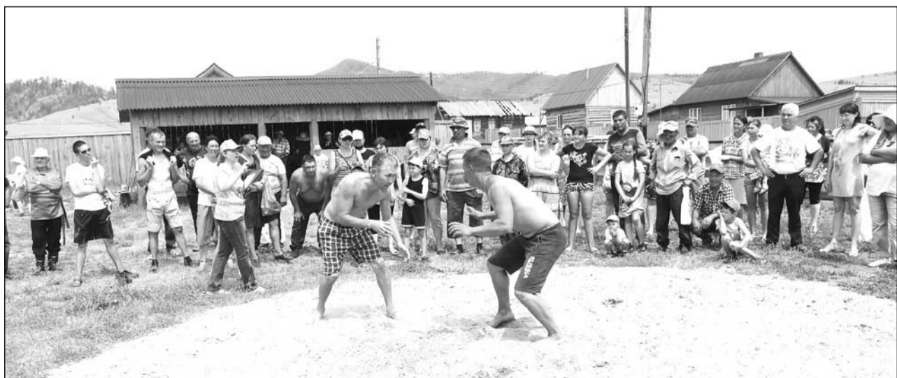
Горячие моменты национальной борьбы