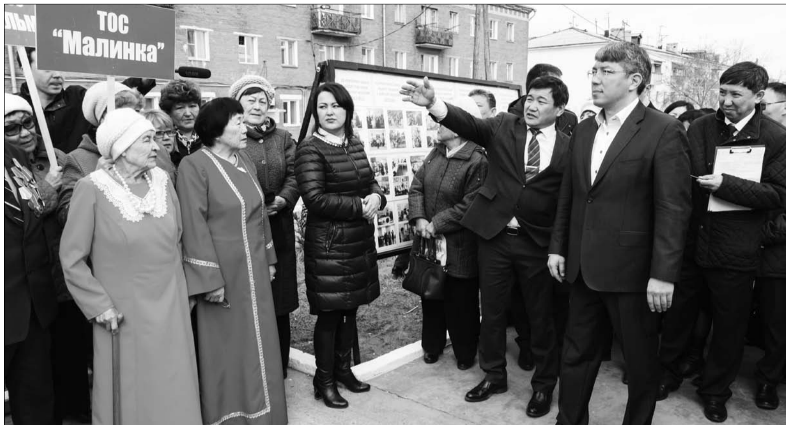
ТОСы Иволгинского района.

В Бурятии выберут лучших лидеров движения