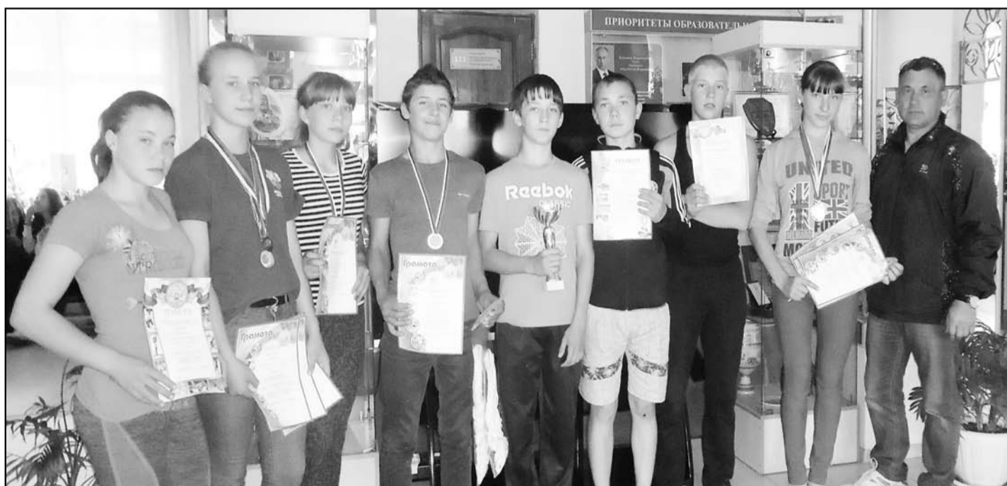
Команда второй раз представляет Бичурский район на соревнованиях

Из 16 команд у наших земляков достойное 3 место