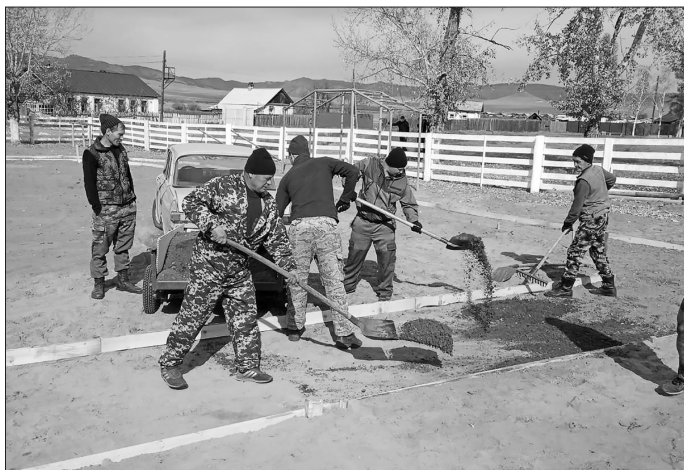
В п. Сахарный Завод

По результатам голосования жители Бичуры выбрали несколько социально значимых проектов. В Бичурское поселение поступило 2809,5 тыс. рублей, они осваиваются совместно с ТОСами «Победа», «Старт», «Надежда-2», «Вместе на доброе дело».