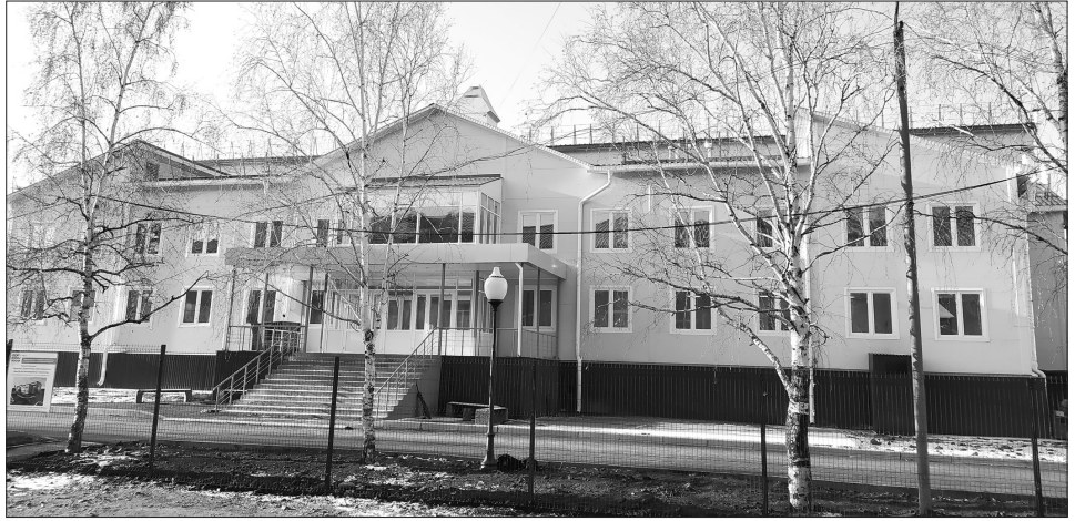
Физкультурно-спортивный комплекс в Бичуре готовится к открытию