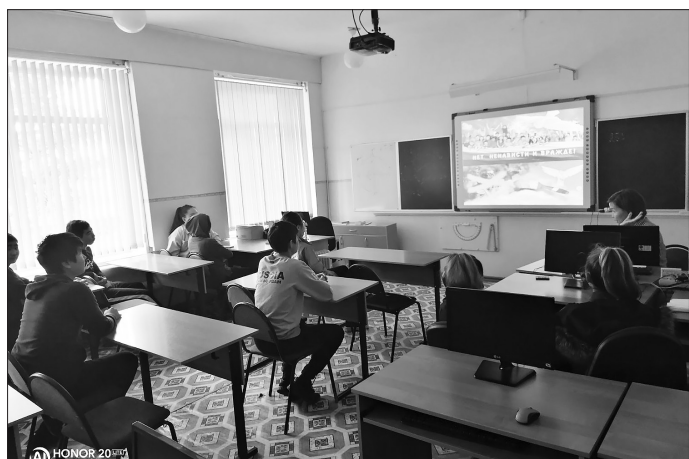
В Шибиртуйской школе

В рамках оперативно профилактического мероприятия «С ненавистью и ксенофобией нам не по пути» сотрудники отдела участковых уполномоченных и по делам несовершеннолетних ОМВД России по Бичурскому району с педагогами школ дистанционно организовали цикл лекций.