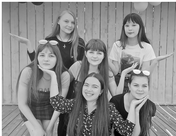
Студию «Веснушки» знают и как спутник народного ансамбля «Сибирячка»