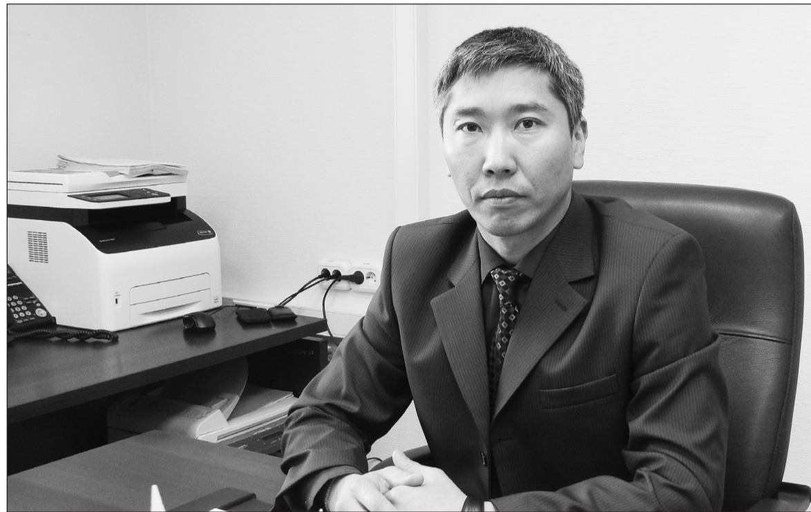
Через сервис можно получить информацию о местах работы и страховых взносах

Новые технологии позволяют назначать пенсию бесконтактным способом