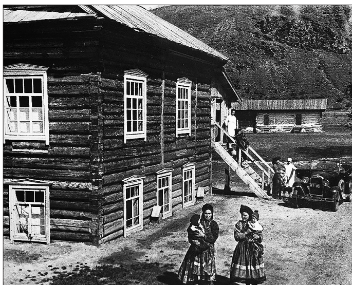
Роддом колхоза «Красное знамя труда», фото В. Руйковича, 1938 год

Седого и других. Портреты опубликованы в Интернете и их можно посмотреть. Виктор Руйкович был светлым человеком, оптимистом и жизнелюбом.