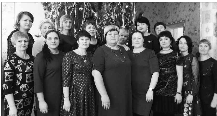
Коллектив детского сада

Детский сад — это волшебная страна с необычной атмосферой, наполненная детским смехом, восторгом, удивлением. Для ребенка пребывание в этом чудесном мире детства — незабываемые моменты первых открытий, успехов, достижений и побед. Работать здесь может не каждый, а только люди с добрым сердцем и открытой душой, способные любить всех детей одинаково и осознавать ценность