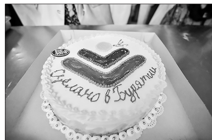
22 августа Глава Бурятии Алексей Цыденов посетил крупные местные предприятия пищевой промышленности — ОАО «Бурятхлебпром» и мясную фабрику «Селенга».

Алексей Цыденов: «Наша задача, чтобы местное предприятие работало стабильно»