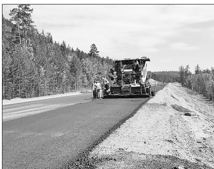
В республике вышли на финишную прямую ремонтные работы, которые ведутся в рамках нацпроекта «Безопасные и качественные автомобильные дороги». По итогам года дорожники приведут в нормативное состояние 64% дорог в Улан-Удэнской агломерации, также будет отремонтировано 18 объектов на региональной сети дорог.

Глава Бурятии Алексей Цыденов осмотрел ряд участков дорог, которые ремонтируются в рамках нацпроекта. Первым объектом стал «Спиртзаводской тракт». На 1,5-километровом участке дороги от ул. Пищевая до 0 км подрядчики уложили новый асфальтобетон. Также обустроены тротуары тактильной плиткой. По итогам осмотра Глава дал поручение выставить претензии подрядчику на Спиртзаводском тракте. В рамках гарантии подрядчик должен устранить износ бровки, которые делает съезд с дороги небезопасным.