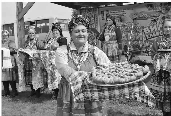
Угощение из села Шаралдай Мухоршибирского района