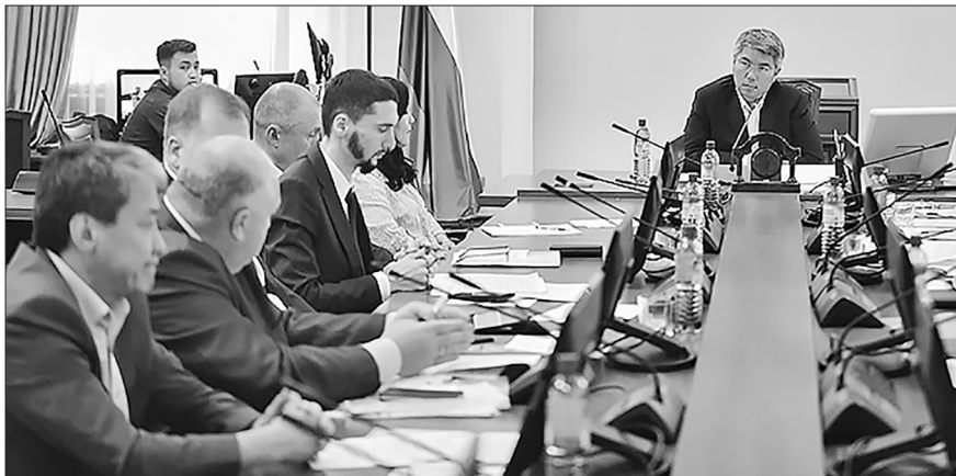
Алексей Цыденов в среду, 21 августа, провел совещание по подготовке муниципальных образований к отопительному сезону 2019–2020 годов.

— Вопрос наиважнейший — подготовка к зиме. Мы должны до начала сезона решить все вопросы, чтобы в осенне-зимний сезон обеспечить бесперебойное теплоснабжение в домах наших жителей, — отметил Глава Бурятии. По оценке Минстроя Бурятии, в целом работа по республике подходит к завершению. Готовность тепловых сетей составляет 81%, при установленном графиком среднем проценте 75%. При этом некоторые районы допустили отставание от графика — Закаменский, Муйский, Прибайкальский, Северо-Байкальский, Тункинский и Северобайкальский.