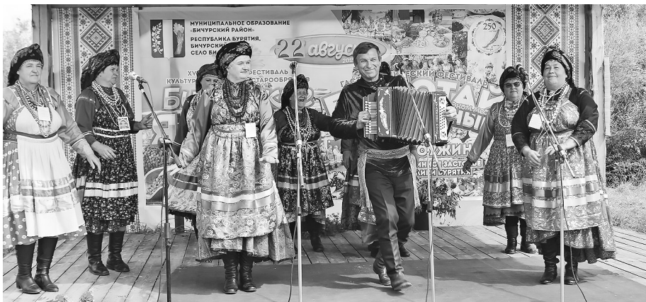
Народный ансамбль «Воскресенье»

В концертной программе праздника участвовали фольклорные коллективы Бичурского района — народный ансамбль «Рябинущка» из Билютая, народный ансамбль «Воскресенье» и детский образцовый ансамбль «Васильки» из Бичуры,