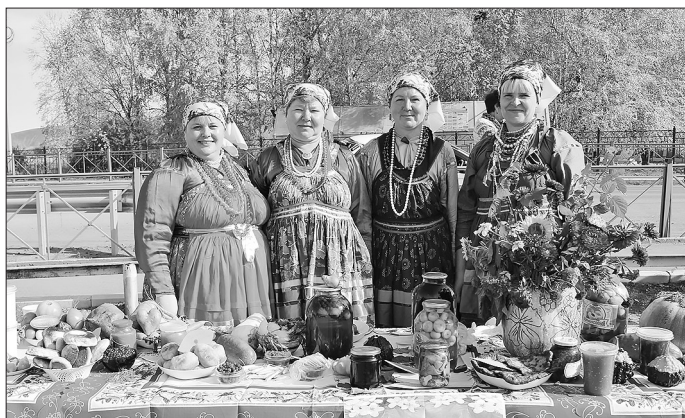
Мотнинский СДК представлял коллектив «Черёмушки»