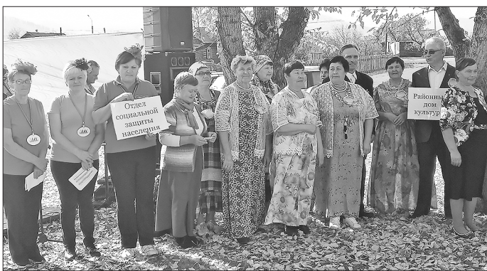
Команды «Принцессы из собеса» и «Надежда» готовы состязаться

В танцевальном конкурсе в вальсе кружили «Надежда» РДК и «Смешарики» Малого Куналея, задорную кадрили исполнили «Вольные казачки» из Дунда-Киретского поселения. «Принцессы из собеса» Отдела соцзащиты по Бичурскому району пригласили на флеш-