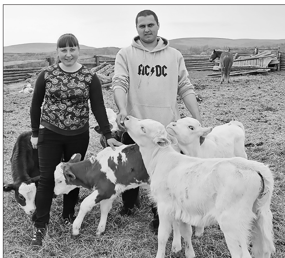
Хорош уход — хороши телята!