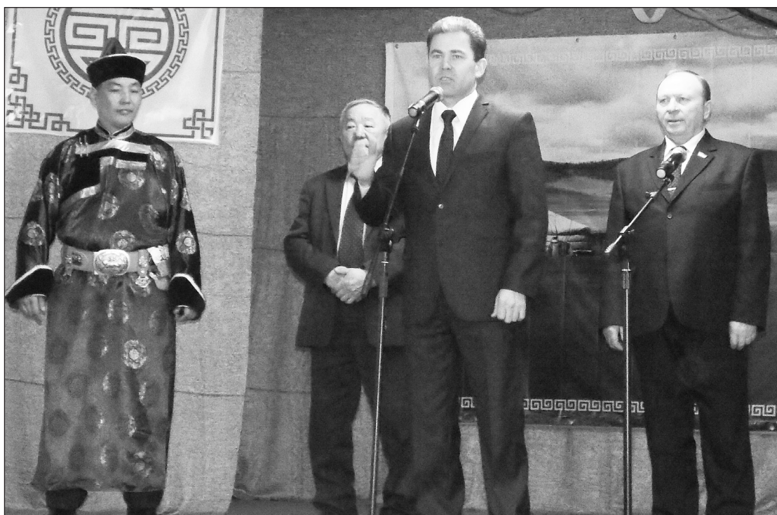
На торжественном открытии

В улусе Шанага 4 марта провели районное мероприятие в рамках народного праздника «Сагаалган» и Года экологии в России. В нём приняли участие коллективы, работающие в этнофольклорном направлении, солисты — исполнители бурятских народных и эстрадных песен. А также участники представляли лучшие образцы современной одежды бурятского народа. Материал о событии читайте на 2 странице.