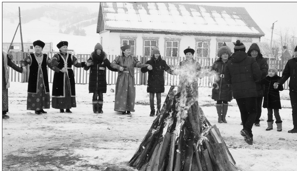
Праздник завершился традиционным ёхором вокруг костра