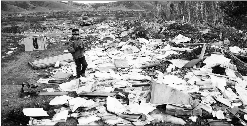
Свалка у абрикосовой рощи