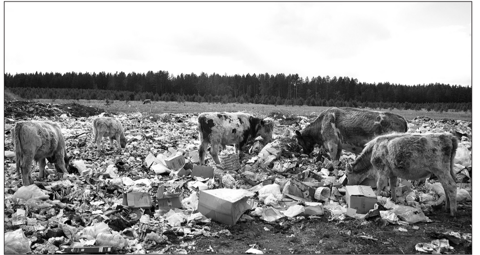
Центральная свалка (ПТБО)