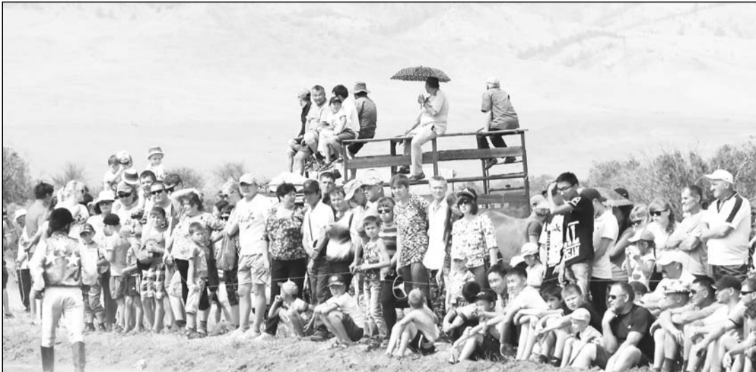
Как всегда конные скачки привлекают много зрителей

Новыми традициями обрастают праздники с многовековой историей