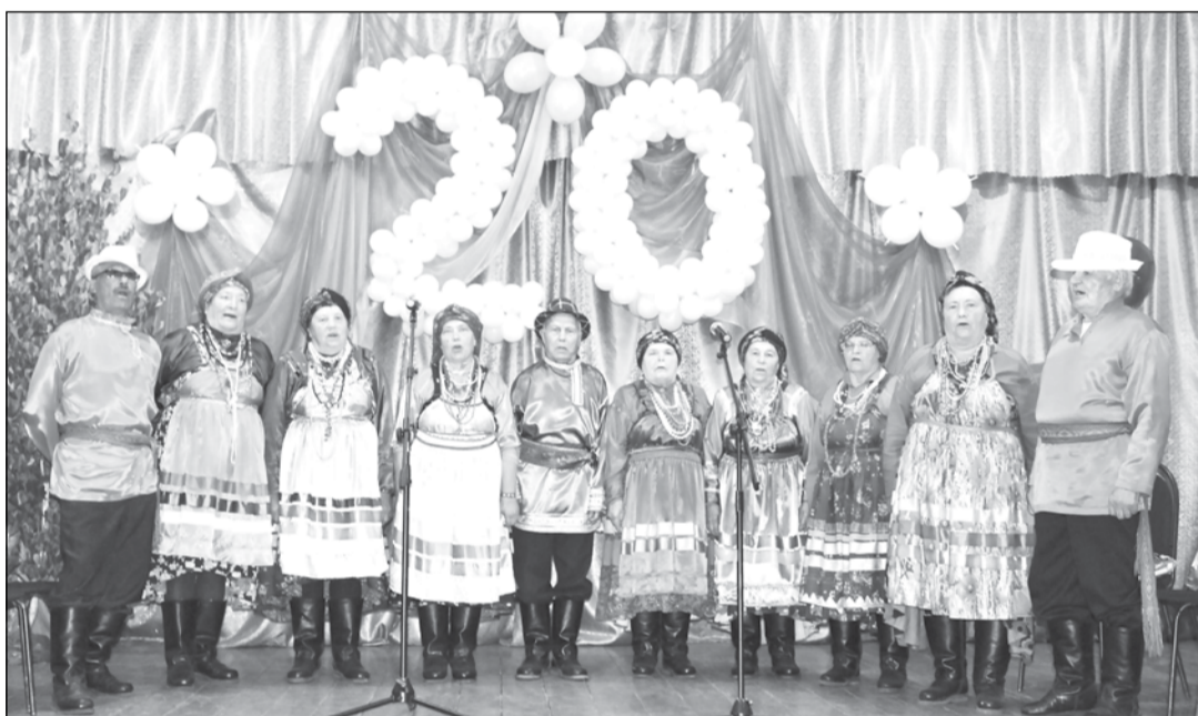
В составе ансамбля 10 человек. Возраст участников — от 65 до 85 лет

Ансамбль «Родники» отметил свое 20-летие