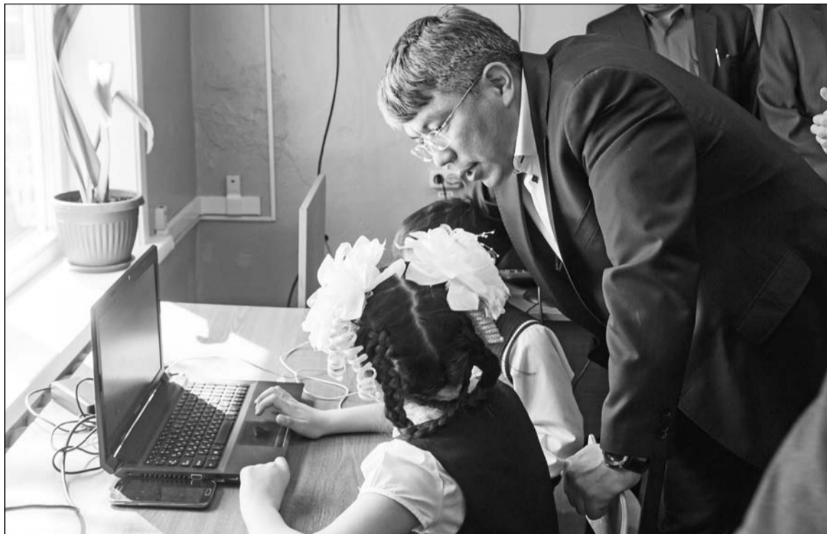
Кижингинский лицей, класс программирования.