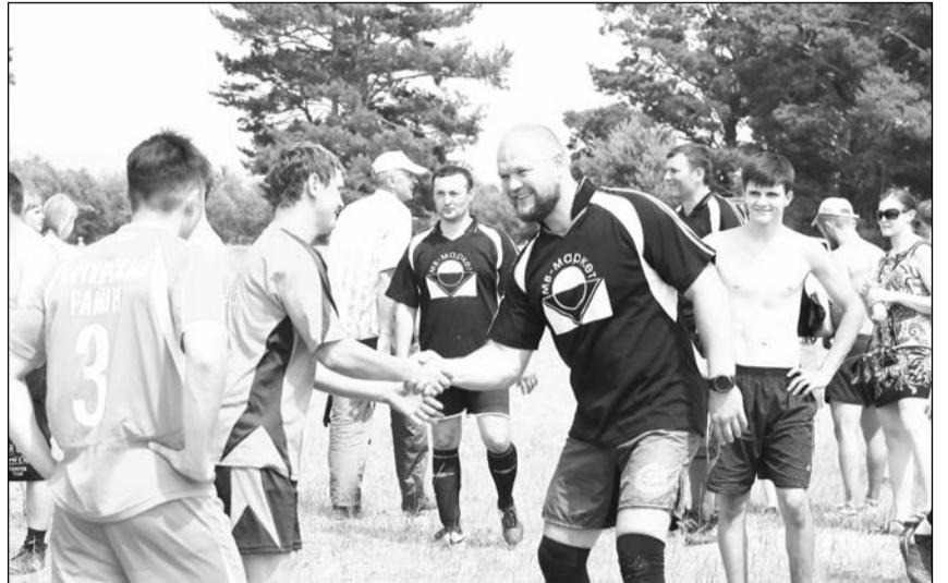
Дружеские рукопожатия после игры в футбол

В древности «Сурхарбаном» называли соревнования по стрельбе из лука, сейчас так именуют весь культурно-спортивный праздник.