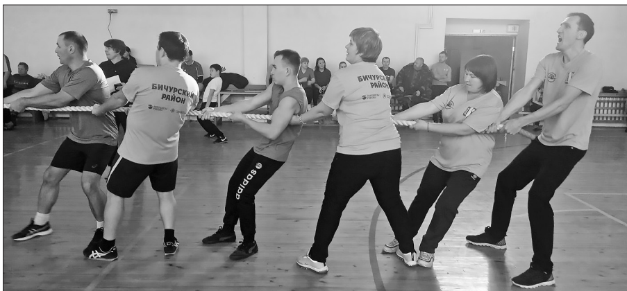
Бронзовые призёры в перетягивании каната