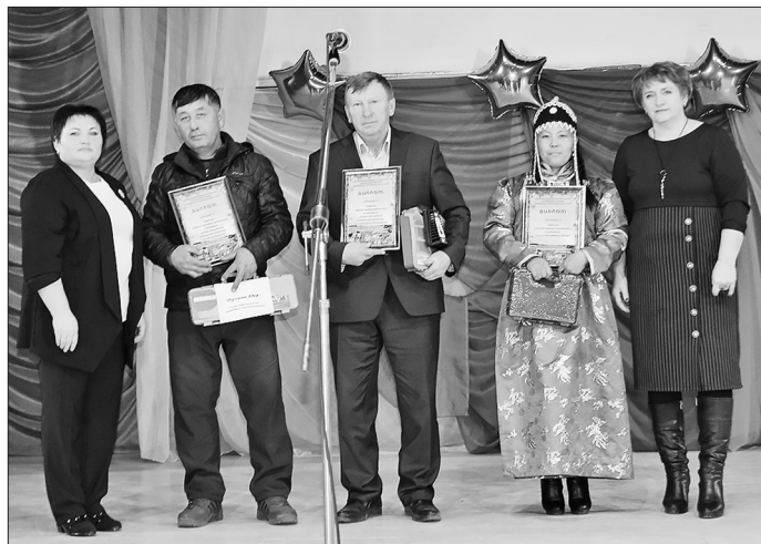
Награждены лучшие КФХ района

В завершение праздничного мероприятия состоялся розыгрыш «Счастливого места в зале», 5 призов — свою продукцию — предоставили ООО «Бичурский маслозавод» и ООО «Еланская гречиха».