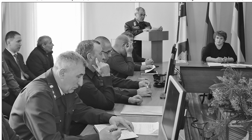
Безопасности лесов — постоянную заботу

В районе подвели итоги пожароопасного сезона 2018 года и определили задачи на следующий год