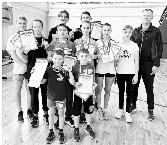
Команда легкоатлетов ФСК