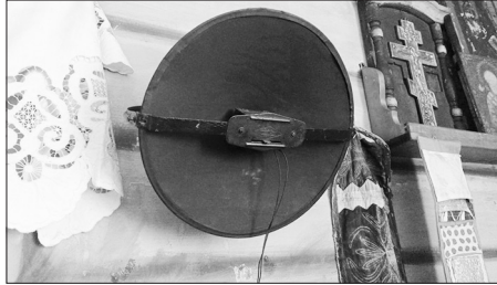
В музее «Родина» Бичурской школы №1 есть такой экспонат — радио военных лет

Мамочка со мной обычно сидела ночью на печке, прислонялась спиной о трубу, ставила лампу подальше, чтобы я не дотянулась, и дремала всю ночь, держа меня на руках. Может из-за того, что голова у меня болела (с 6 месяцев была «струшена»). Я ночью не спала, по какой причине не знаю, и мама с самого рождения мучилась со мной — ночью я играла. Она вспоминала: «Как только стала стоять на ногах, так и скакала всю ночь, тараша на лампу глазёнки, а если я закрою свои глаза, то ты их ручонками раздвигала. Да и хорошо, а то бы выпустила тебя, если бы уснула. Тебе и так досталось, ещё в шестимесячном возрасте».