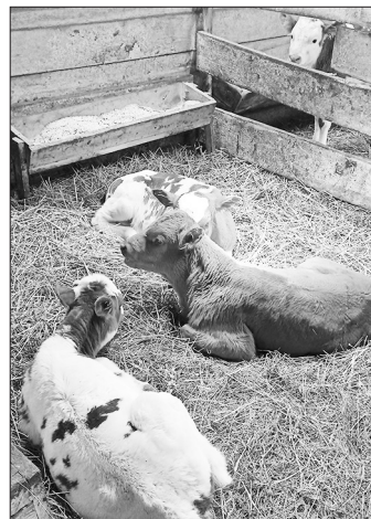
Все помещения МТФ стали удобными для содержания скота