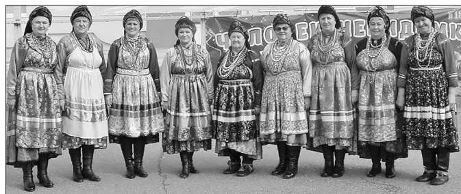
В репертуаре ансамбля семейские песни

С 3 по 6 октября в г. Томск проходил межрегиональный фестиваль-конкурс Сибирского Федерального округа «Томские осенины», в котором приняли участие более 30 творческих коллективов из 9 регионов России.