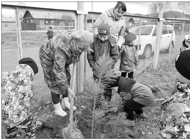
Дошколята с удовольствием помогают взрослым

В Бичурском отделении региональной общественной организации «Женщины Бурятии» давно мечтали создать аллею в честь женщин Бичурского района — участниц Великой Отечественной войны, тружениц тыла, детей войны.