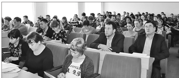
Слушатели готовились отвечать на тестовое задание

В МО «Бичурский район» 11 октября состоялись комплексные мероприятия по профилактике коррупционных и иных правонарушений.