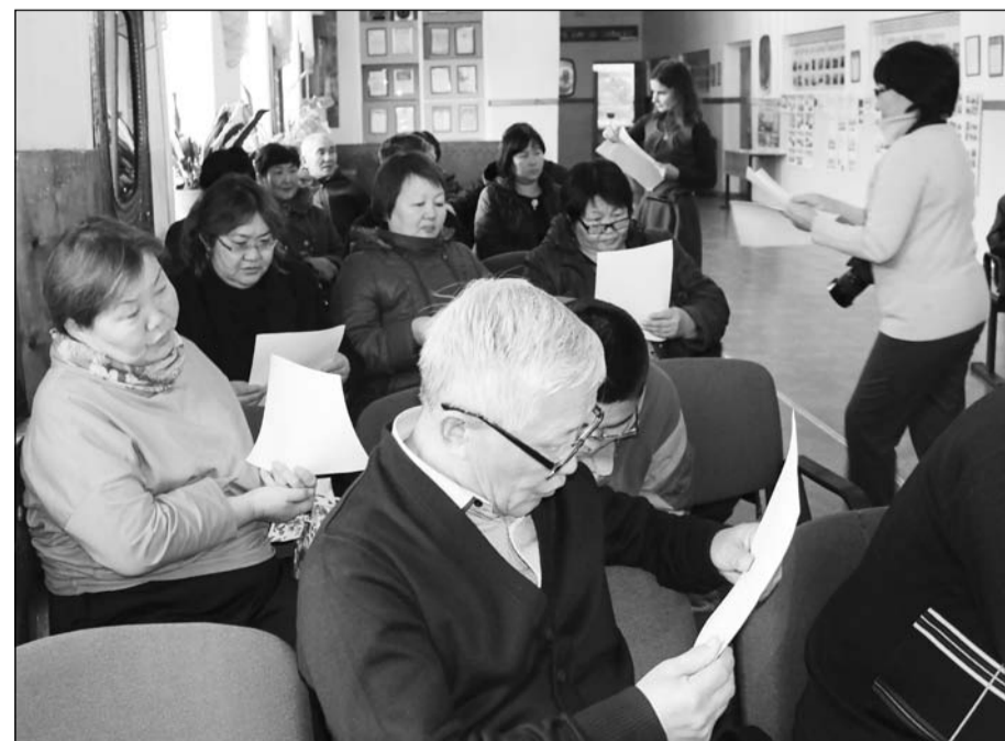
Шибертуйскому поселению помогут с разработкой проекта развития