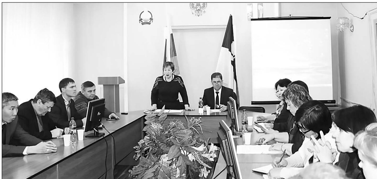
На круглом столе в райадминистрации

Представители Консультативного совета женщин при Главе РБ посетили наш район