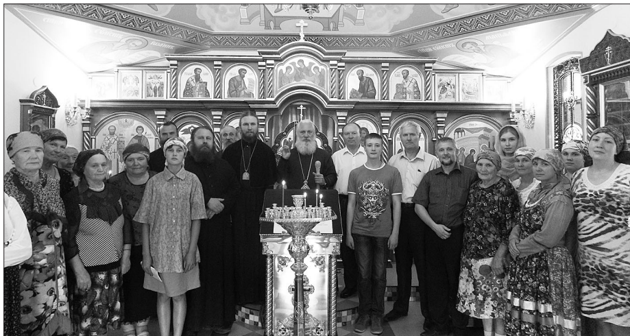
Послушать патриарха было интересно молодым и пожилым сельчанам

Уже третий раз новосретенцы встречали патриарха