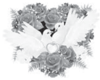
Дети и внуки, г. Улан-Удэ

У вас сегодня свадьба золотая, Она как символ верности, любви! И поздравляет вас семья большая, Основа для которой — это вы! И ваше счастье пусть не угасает, Вы продолжайте верить и любить! И внукам пусть в пример вас ставят — Как надо долго и счастливо жить!