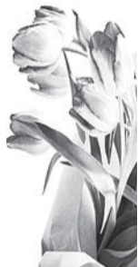
Дети, внуки и правнуки

Спасибо, мама, что ты есть, С тобой все наши невзгоды Теряют свой тяжёлый вес. Ты нас поставила на ноги, Пройдя тяжёлый, длинный путь. С тех пор мы подросли немного, Твоей любви нам не забыть. Мы знаем, с нами было трудно, Но ты старалась, как могла, Чтоб не один не вырос грубым, Чтоб доброю душа была, Теперь мы можем сказать смело — Твои уроки впрок пошли. Сейчас мы стали одним целым, Мы вместе трудности прошли. И если солнце вдруг не светит, И станет холодно в душе, Ты знай — ты лучшая на свете, И то, что не одна, с тобою дети! Семьдесят пять лет — это возраст солидный! Мы поздравляем от сердца, с душой! Семьдесят пять лет — это опыт завидный, День очень важный и праздник большой! Близкие пусть окружают любовью, Дарят заботу свою день за днём! Счастья желаем, покрепче здоровья! Пусть будет полон улыбками дом!