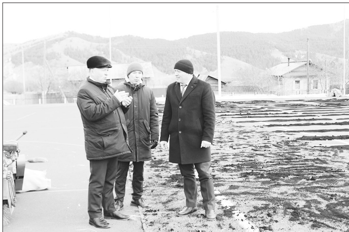
На спортивной площадке в школе №2