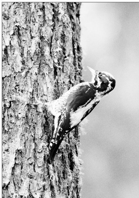
Трёхпалый за работой

Трёхпалый — великий труженик, на зимовку он не улетает и неустанно раздалбливает большие деревья, отыскивая личинки короедов. Этим он приносит огромную пользу в оздоровлении леса. Упёртость в работе подтверждается снимками,