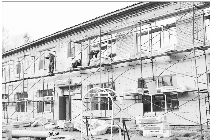
Утепление здания детского сада «Подснежник»