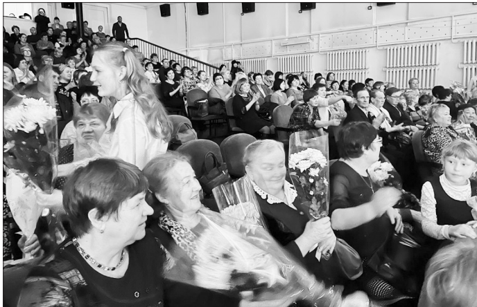
В зале в первую очередь почествовали приглашённых ветеранов педагогического труда