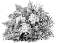
Коллектив Бичурской школы №2

Хотим поздравить искренне, сердечно И много счастья в жизни пожелать, Пусть все мечты, задумки и надежды Удача помогает воплощать. Любви, благополучия желаем, Поддержки близких и родных людей, Успехов, интересных начинаний И настоящих преданных друзей!