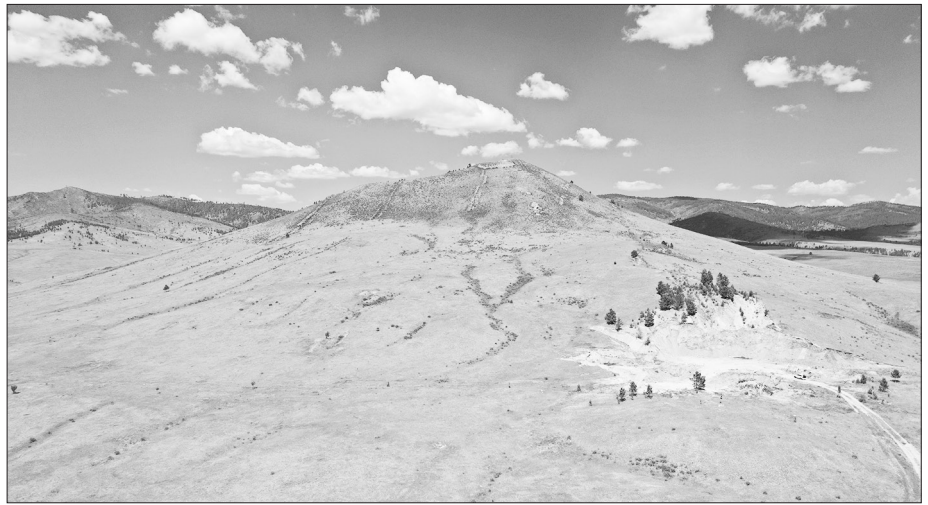
Сопка. Вид с квадрокоптера

Ну а мы рассматриваем юго-западный склон горы: его столкали под откос мощным бульдозером. Поддавшийся искус-