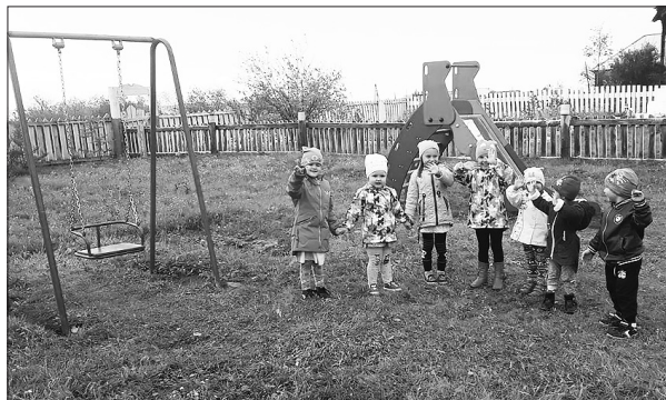
В детсаду «Колокольчик»

В Буйское сельское поселение по народному голосованию поступило 310,2 тыс. рублей.