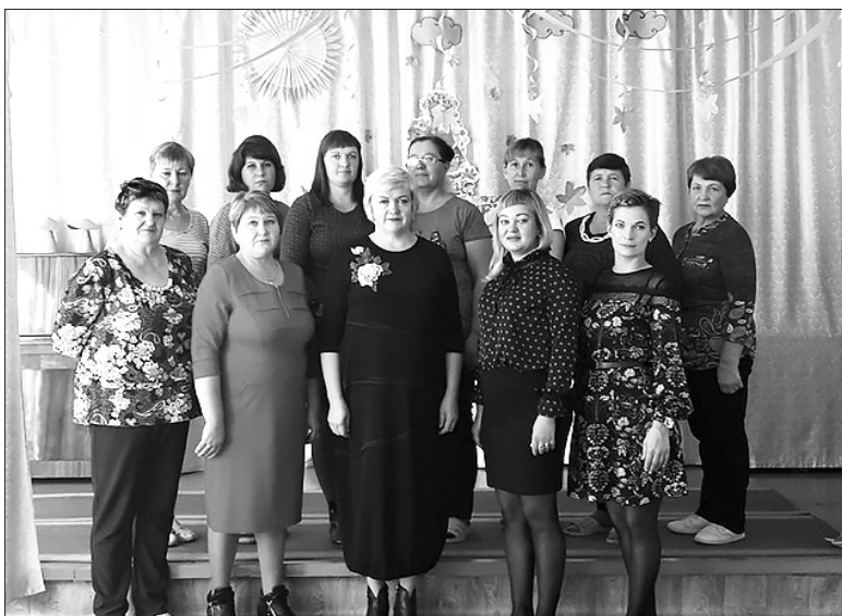
Детский сад «Ручеек» участвовал в акции РОО «Бурятская Ассоциация потребителей», стал лауреатом и получил диплом «Лучшая услуга — 2019» в номинации «Развитие предметно-пространственной среды»