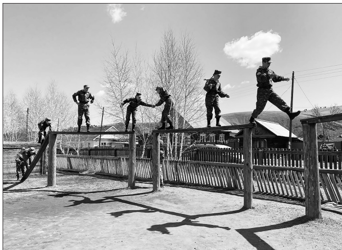
Команда «Соболь» на полосе препятствий

Команда-победитель представит Бичурский район на республиканской военно-спортивной игре «Победа». Пожелаем ребятам и их руководителям успешных стартов и победы.