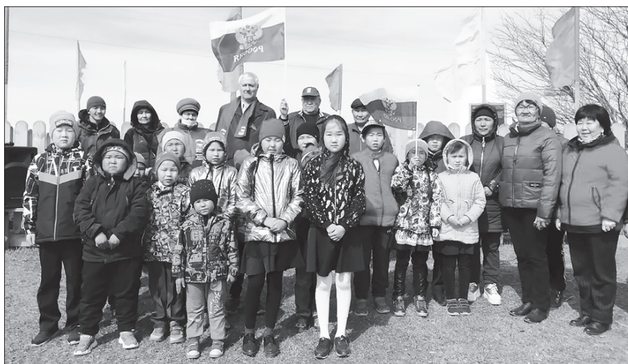
Встреча в улусе Дабатуй