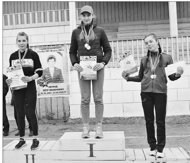
Победители в беге на 200 метров