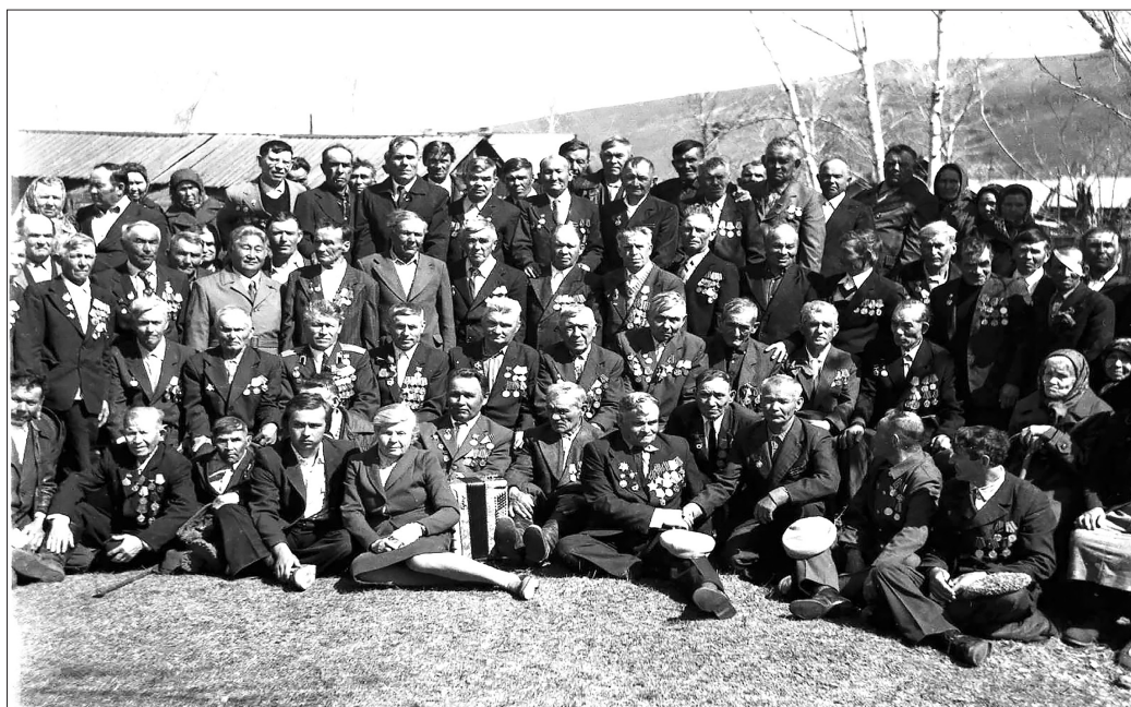
Ветераны Малого Куналя. 9 мая 1985 г.

Салют и слава годовщине Навеки памятного дня.