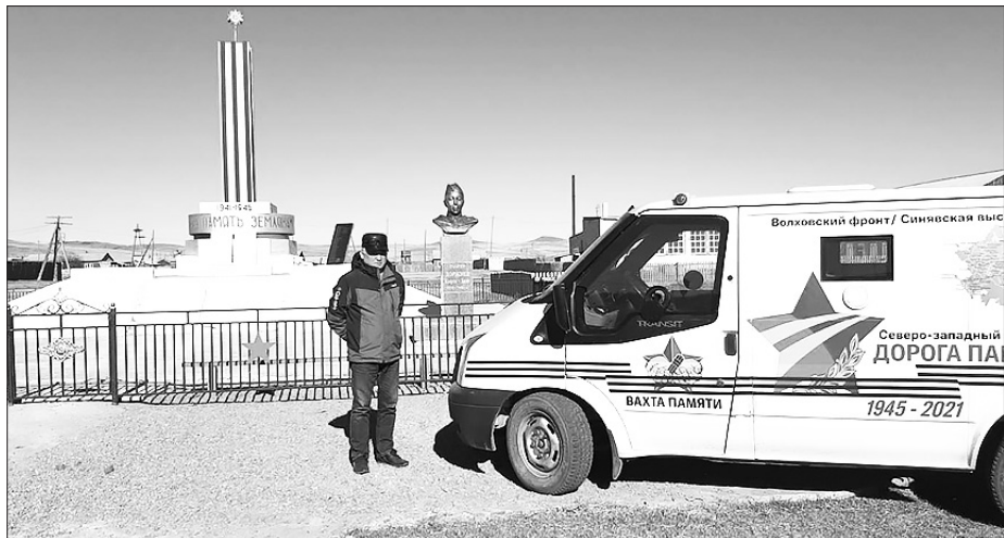
Мемориал в с. Хошун-Узур

Подвижник — тот, кто самоотверженно борется за достижение высоких целей на каком-либо трудном поприще.