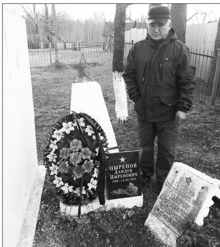
Памятная доска на могиле земляка