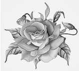
Дети, внуки, правнуки

С юбилеем тебя поздравляем, Самый близкий, родной человек, И здоровья тебе мы желаем Не на год, а на долгий твой век! За добрую душу и тёплое слово, За то, что не видели в жизни плохого, Спасибо тебе, наш родной человек, Желаем здоровья на долгий твой век!