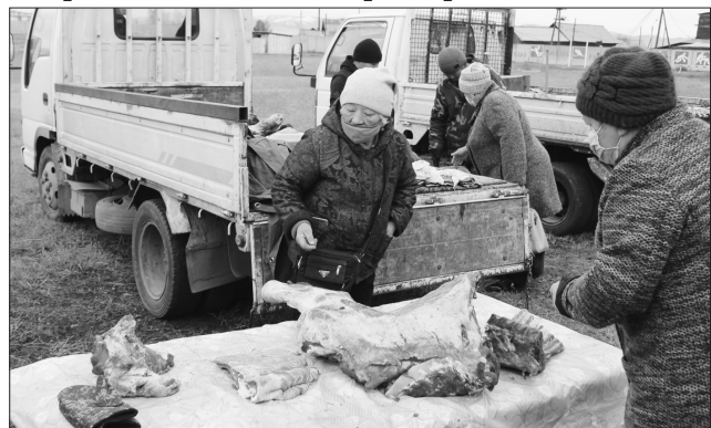
Харлунское мясо пользуется спросом

Впервые осенняя ярмарка в Бичуре не была многолюдной. Она проходила на центральном стадионе с соблюдением санитарных норм и масочного режима.