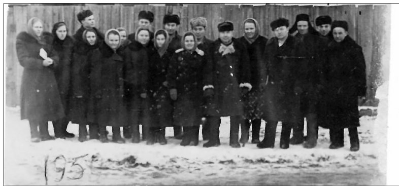
Коллектив редакции и типографии. 1959 г.