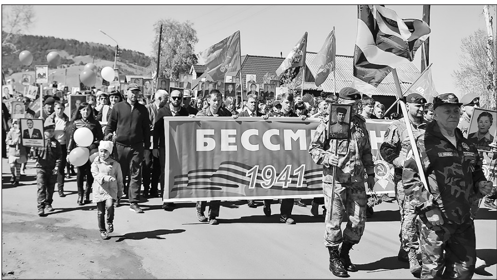
С каждым годом в акции участвуют всё больше людей