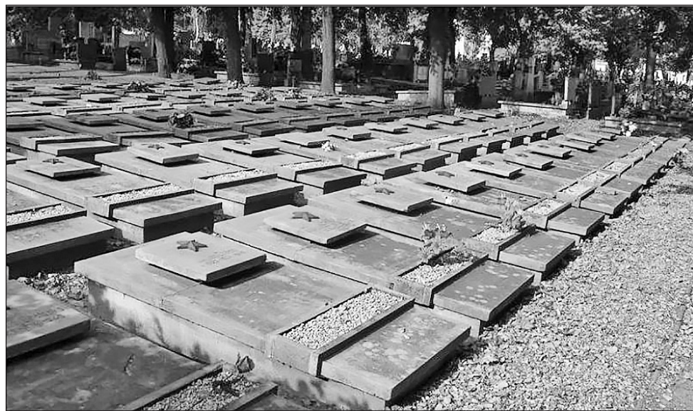
Общий вид воинского захоронения в Гнезно