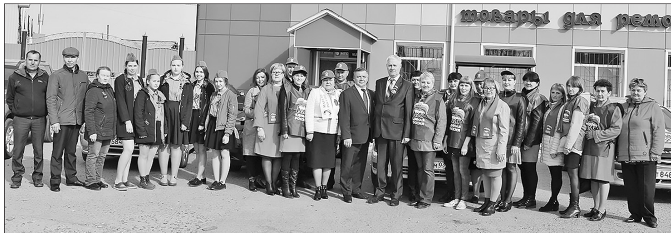
Автопробег проходит в Бичурском районе с 2015 года

Местное отделение партии «Единая Россия» и МО РОО «Женщины Бурятии» 26 апреля организовали автопробег, посвящённый Дню Победы.