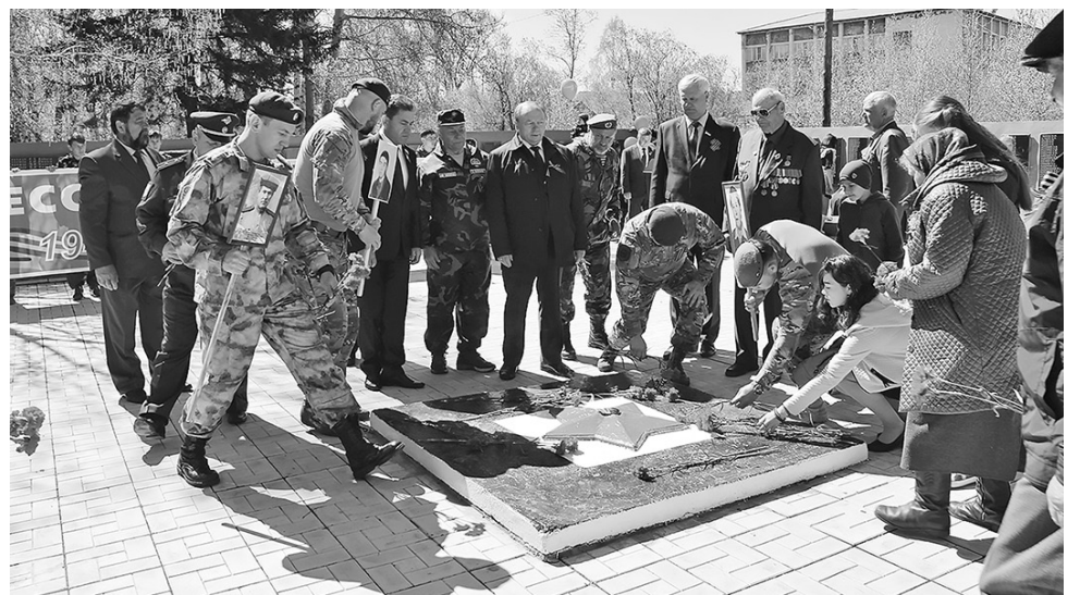
Возложение цветов в память о ветеранах войны

С каждым годом все дальше от нас май 1945-го. С той памятной даты уже прошло 73 года. Сегодня живых свидетелей тех страшных лет становится все меньше. Даже дети войны постарели. Но память живет в сердцах детей, внуков и правнуков. Растет и ширится «Бессмертный полк». Он проходит по всей стране — в каждом населенном пункте. Ведь нет такой семьи, которую не коснулась Великая Отечественная война.