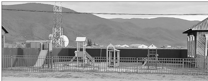
Детская площадка в селе Аргата Курумжанского района

местных мальчишек, которые интересуются военной техникой и хотят быть похожими на героев-земляков.