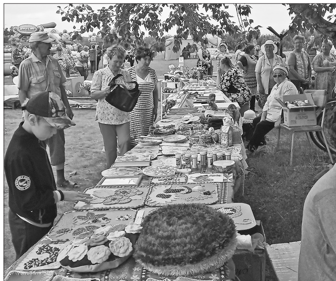
Куналеиские сувениры от ТОС «Берегиня»

— Здорово, когда люди встречаются, ведь многие заняты в своих хозяйствах, огородах, а сюда пришли, чтобы отдохнуть, пообщаться. На этом празднике у нас произошла спонтанная встреча одноклассников, некоторых не видел с момента окончания школы. Хотя юбилейная дата 40-летия выпуска у нас в следующем году, для всех это было приятной неожиданностью. Хочется, чтобы ещё больше людей приходило на такие мероприятия.