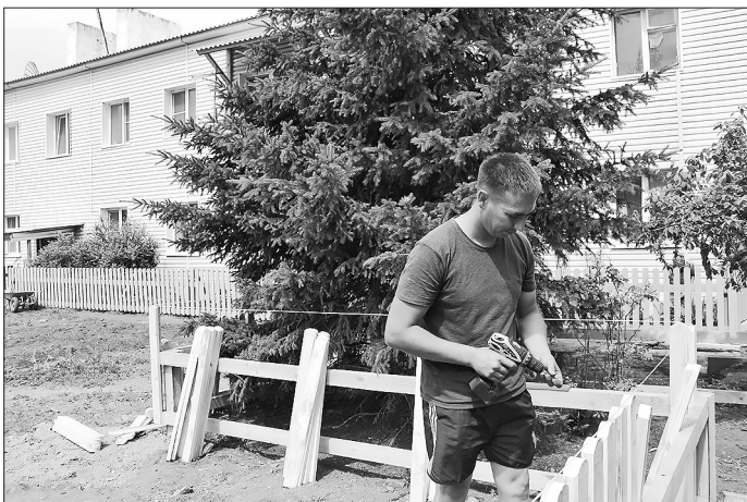
В с. Бичура жители после работы помогают благоустраивать свой двор