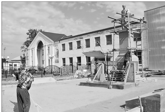
Реконструкция памятника воинам Великой Отечественной войны в посёлке Онохой

306 млн. рублей. Сделать комфортнее и уютнее населенные пункты по всей стране поручил Владимир Путин. Благоустройство проводится в рамках национального проекта «Жилье и городская среда» и продлится до 2024 года.