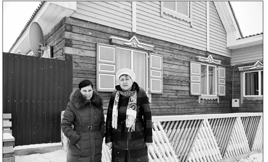
Новые дома на селе — положительный фактор