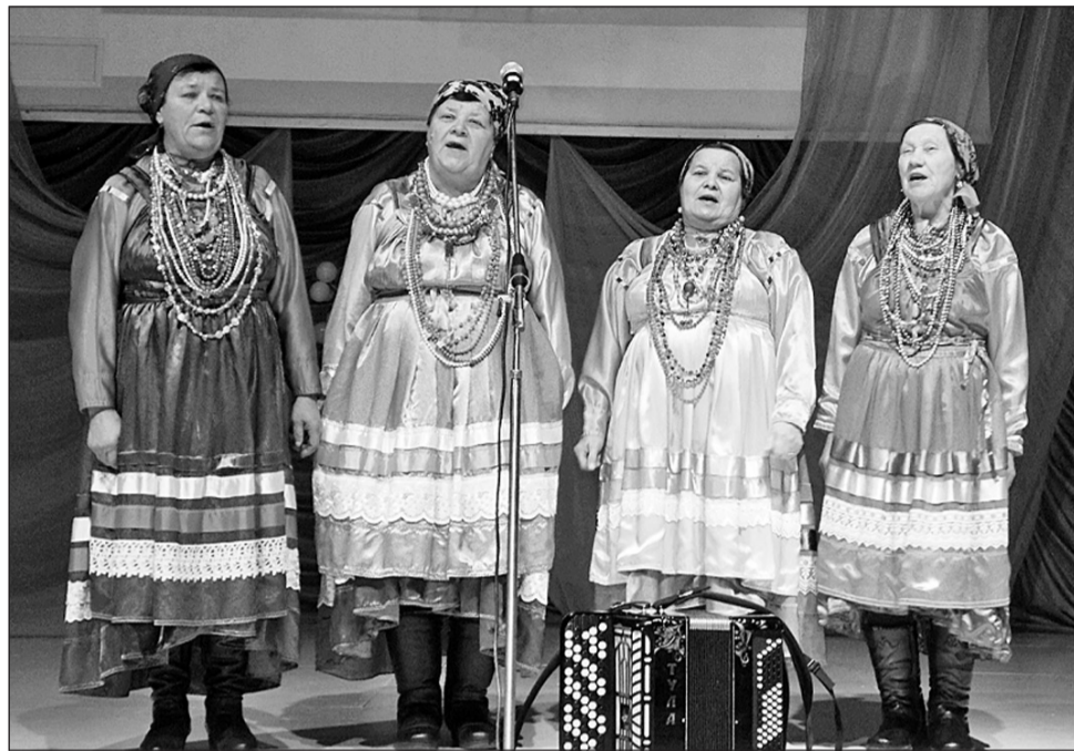
Ансамбль «Рябинушка» — участник II Международного фестиваля «Раздайся, Корогод!»