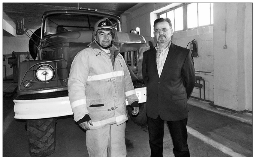
Сотрудники пожарной части всегда в готовности