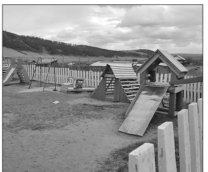
Игровая площадка детсада «Золотая рыбка»

На 01.01.2021 г.: численность населения — 418 человек. В экономике занято 212 человек. Пенсионеров — 58. Детей — 136. Родились 7 детей, умерло 4 человека. Прибыл 1, выбыли 17 человек. Дворов — 110, из них товарных 83, не занимается ведением ЛПХ 23 двора.