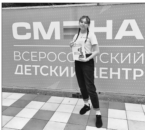
Поездка запомнится надолго

За эти две недели все очень подружились, стали большой семьёй. Расставаясь, мы не могли сдержать слёз и пообещали дружить дальше.