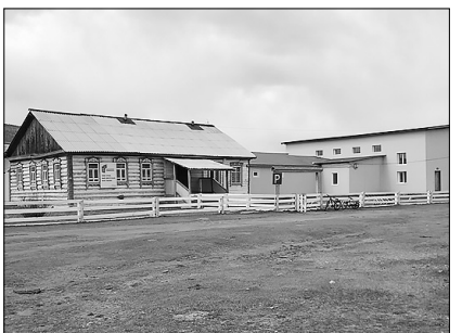
Хонхолойская начальная школа