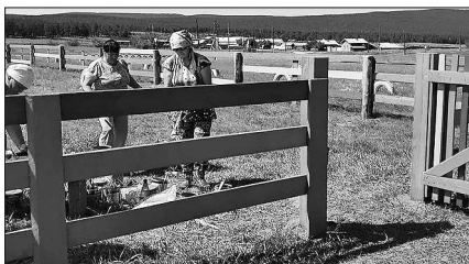
ТОС «Околица» на благоустройстве детской площадки