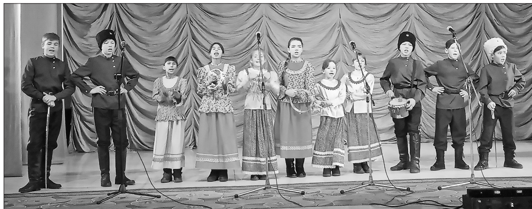
«Едут по Берлину наши казаки» в исполнении ансамбля «Казачий круг»

В Бичурском районе дан старт мероприятиям, посвящённым 75-летию Победы