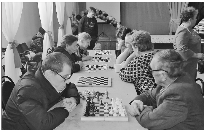
В местном отделении отметили Международный день инвалидов

В районном Доме культуры 5 декабря прошла традиционная встреча, где инвалиды пообщались, посоревновались, рассказали об успехах и достижениях.