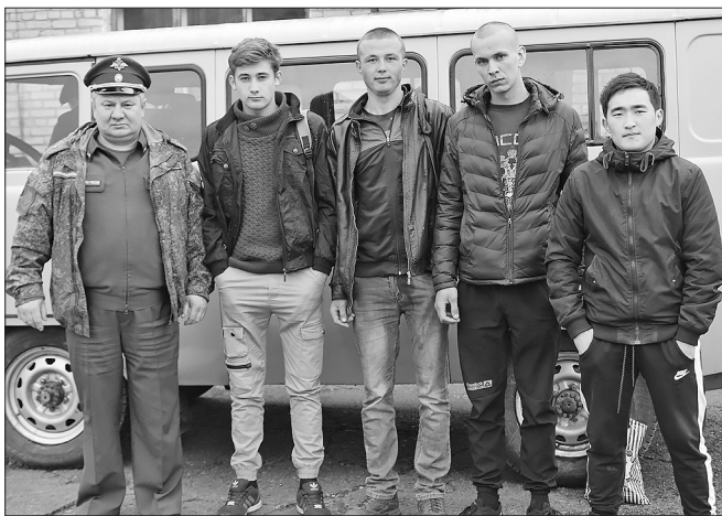
Первая команда новобранцев призывной весенней кампании