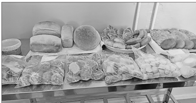
Продукция ООО «Бичура Лес»

Глава района пообещал, что районная администрация и дальше будет поддерживать это предприятие и подобные ему. Пожелал