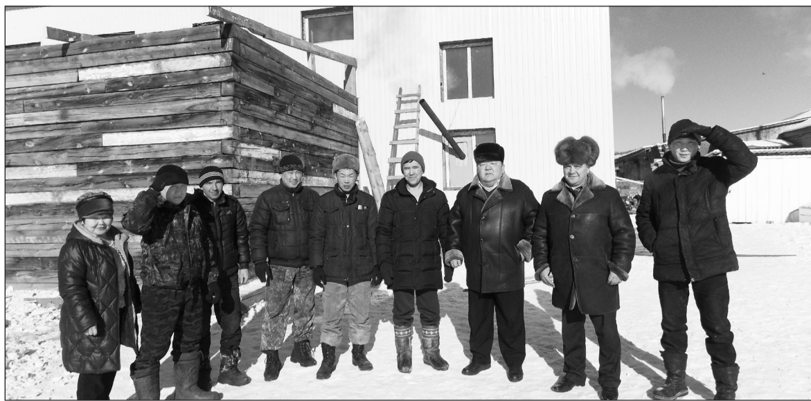
Спортзал в Хонхолое планируют открыть летом этого года