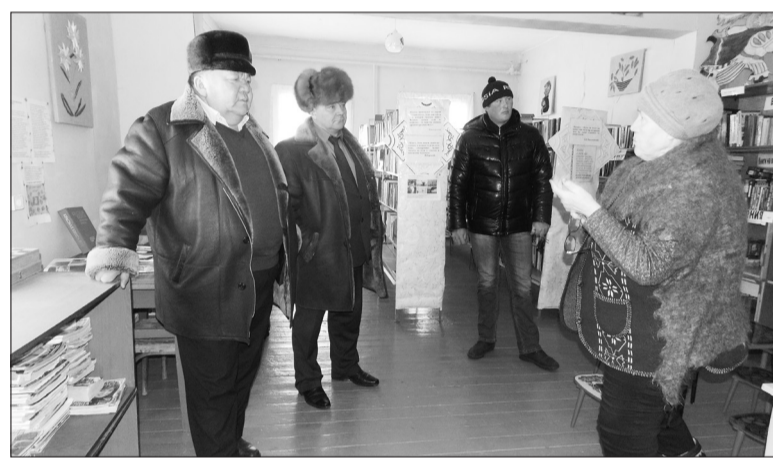
В библиотеке п. Потанино

Председатель райсовета так прокомментировал обстановку в поселении: «Мы запланировали эту поездку в том числе и потому, что в администрацию района с письмом обратились жители Потанино по вопросам функционирования водоканалов, работы местной администрации и другим. В результате выяснено, что в поселении слабо поставлена работа депутатского корпуса, администрации, нет ни