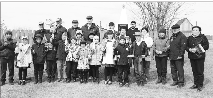
С участниками митинга в улусе Дабатуй