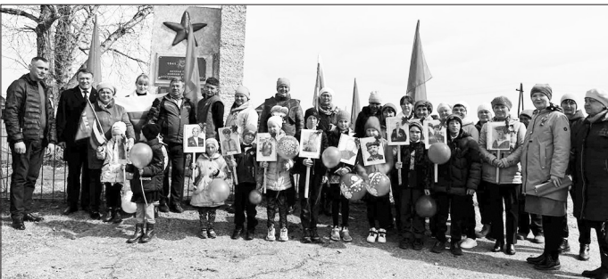
На встрече в селе Топка

В Бичурском районе 5 мая прошёл традиционный автопробег, посвященный 78-й годовщине Великой Победы. Организаторы — местное отделение партии «Единая Россия» и местное отделение «Женщины Бурятии».