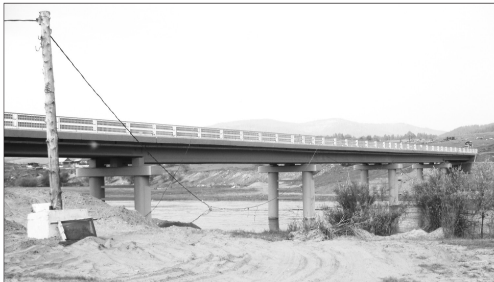
Новый Мангиртуйский мост длиной 153 метра

Международный двенадцатый всебурятский фестиваль, собравший более трех тысяч гостей из Бурятии, Монголии, Забайкалья, Китая, Иркутской области, проходил с 1 по 3 июля в Улан-Удэ. В фестивале принял участие и Бичурский район. Наша делегация достойно выступила во всех конкурсах и спортивных батаях.