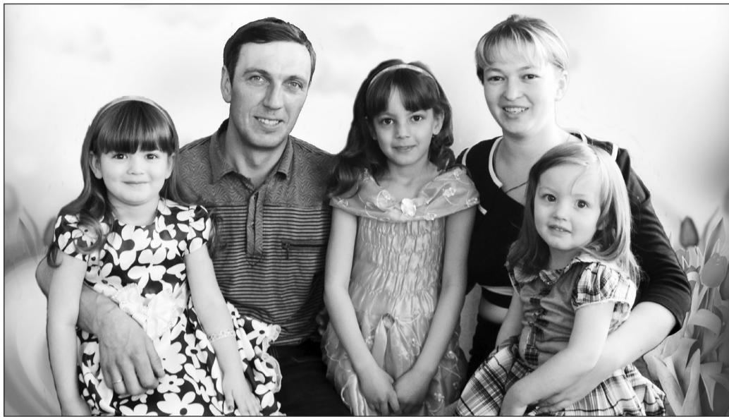
Вместе — дружная семья.

Впервые они встретились в Елани на свадьбе друзей в августе 2007-го. Милая и скромная девушка притягивала внимание высокого голубоглазого бичурского парня. Водителем машины, с которым приехали на выкуп невесты, Андрей сразу заявил: «Смотри — моя будущая жена». Так и случилось.