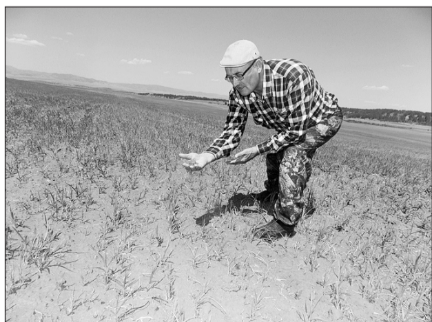
Засуха сгубила посевы