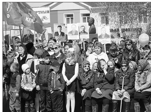
Праздник со слезами на глазах