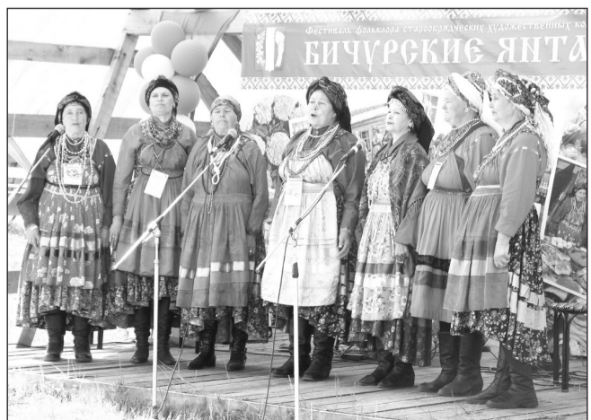
Фольклорный ансамбль «Ивушка»