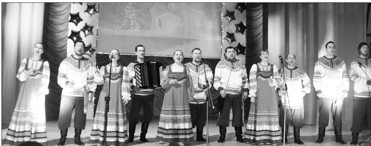
Театр народной музыки и танца «Забавы» не первый раз радует зрителей

В районном Доме культуры состоялся благотворительный концерт