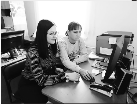
В Центре общественного доступа