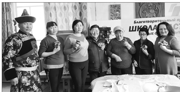
После занятия по валянию шерсти в улусе Хаян

Следующие уроки были посвящены базовым знаниям по декору деревянных поверхностей — искусству декупажа и созданию панно с комнатным термометром. Наши ученицы познакомились с профессиональными материалами — акриловыми художественными грунтами, клеем и лаком, и способами работы с ними. Они