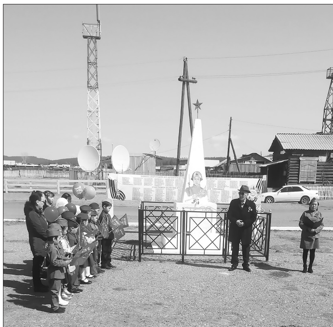
День Победы в улусе Средний Харлун