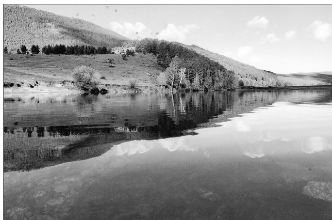
Алтачейское водохранилище. Вид с дамбы

Хорошо, конечно, что к этому времени колхозники стали жить много лучше. На складе теперь выдавали мясо и другие продукты. Да и вовремя построили вторую плотину, которая официально именуется как «распределитель системы орошения» колхозных поскосных угодий и частных приусадебных участков, садов, огородов.