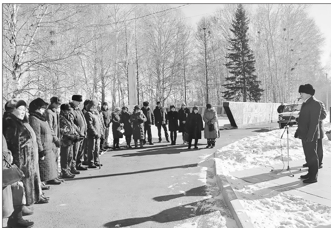
В Бичуре традиционно проходит митинг памяти воинов-интернационалистов