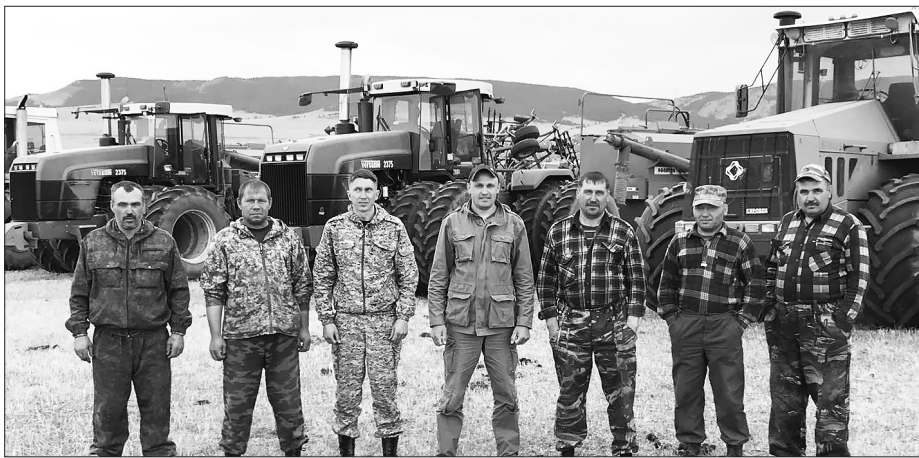
Механизаторы ООО «Победа»

У борочная площадь зерновых культур в этом году в районе составила 10538 га. С полевой площади намолотили в бункерном весе 20016 тонн зерна, 19408 тонн в весе после доработки. К уровню прошлого года валовый сбор чуть ниже 95,8%.