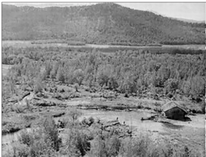
Мельница на Федосеевской поляне.