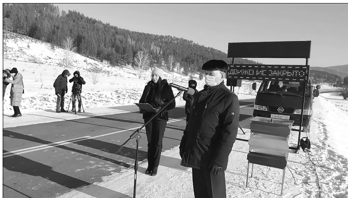
Открытие участка дороги — важное событие для двух районов