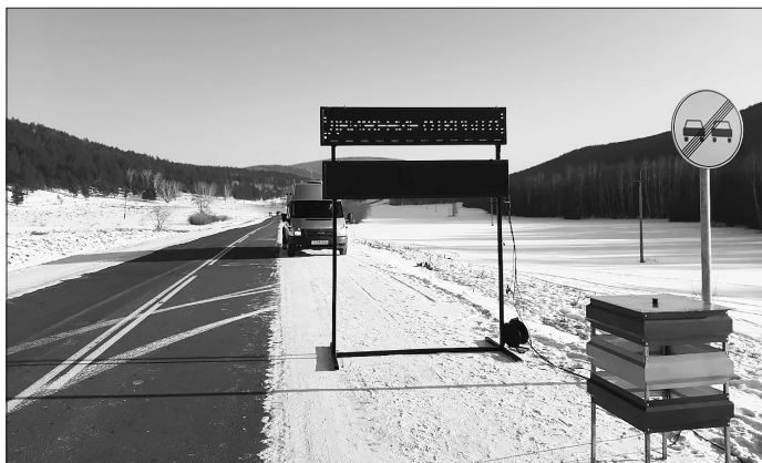
На таких дорогах и расстояния преодолеваются легче