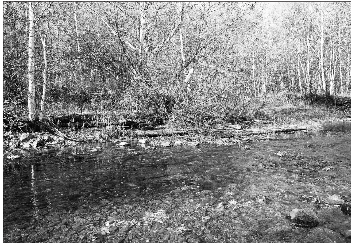
Остатки мельницы сегодня.

П ервые двигатели с приводом от воды появились еще в древнем Риме. Однако использовались они как насосы для подъема воды на поля. Но вскоре стали использовать этот простой мотор для молоты, размолы зерна, и даже пиления леса, трудоёмкой и энергозатратной работы. А пришла эта идея из Китая. Водяные мельницы распространились по Азии, Европе, а оттуда — по всему миру. С началом освоения Сибири мельница «пошла» к себе домой, в сторону Китая, через всю Сибирь и дальше на восток. Вот такой круг во времени и пространстве сделала водяная мельница.