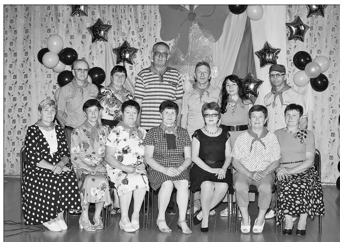
Со дня окончания школы прошло 45 лет