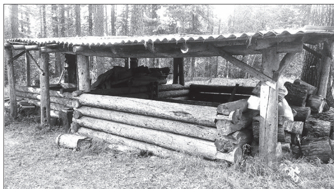
Сайба, как сусек