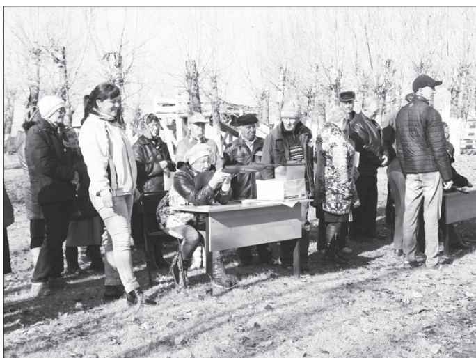
Главное — попасть в цель

Из пневматической винтовки стреляли 25 человек. Мужчины обращались с оружием увереннее, каждый когда-то держал его в руках,