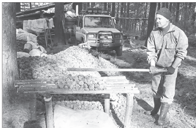
Сайба в работе