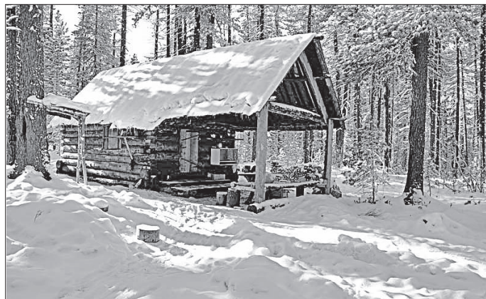
Зимовье в Кокучеле