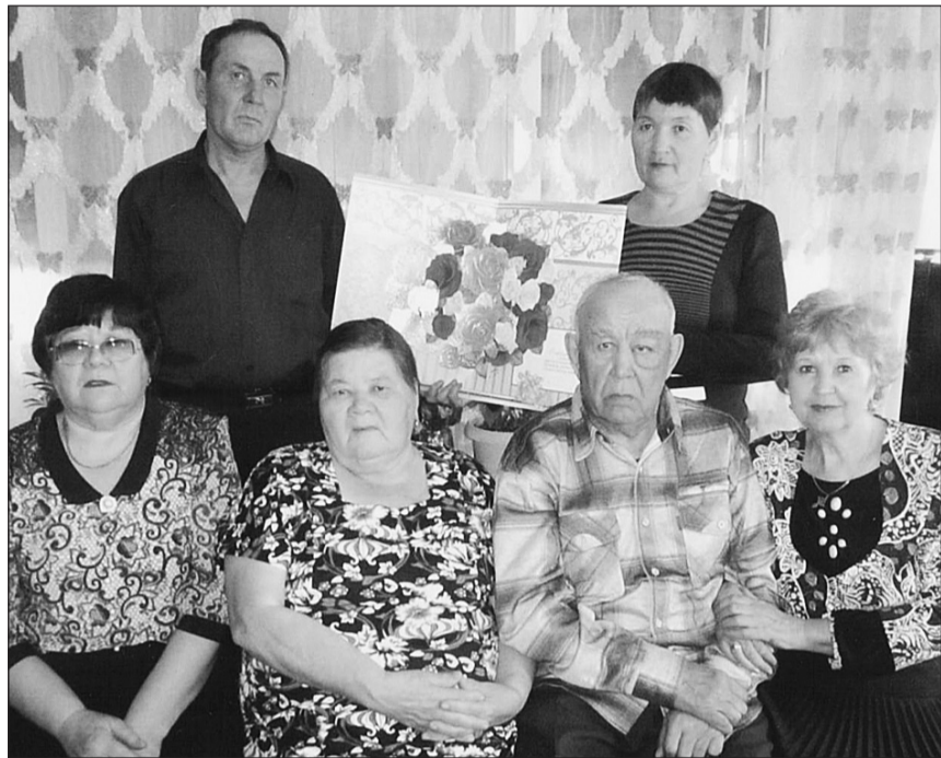
Среди родных всегда тепло