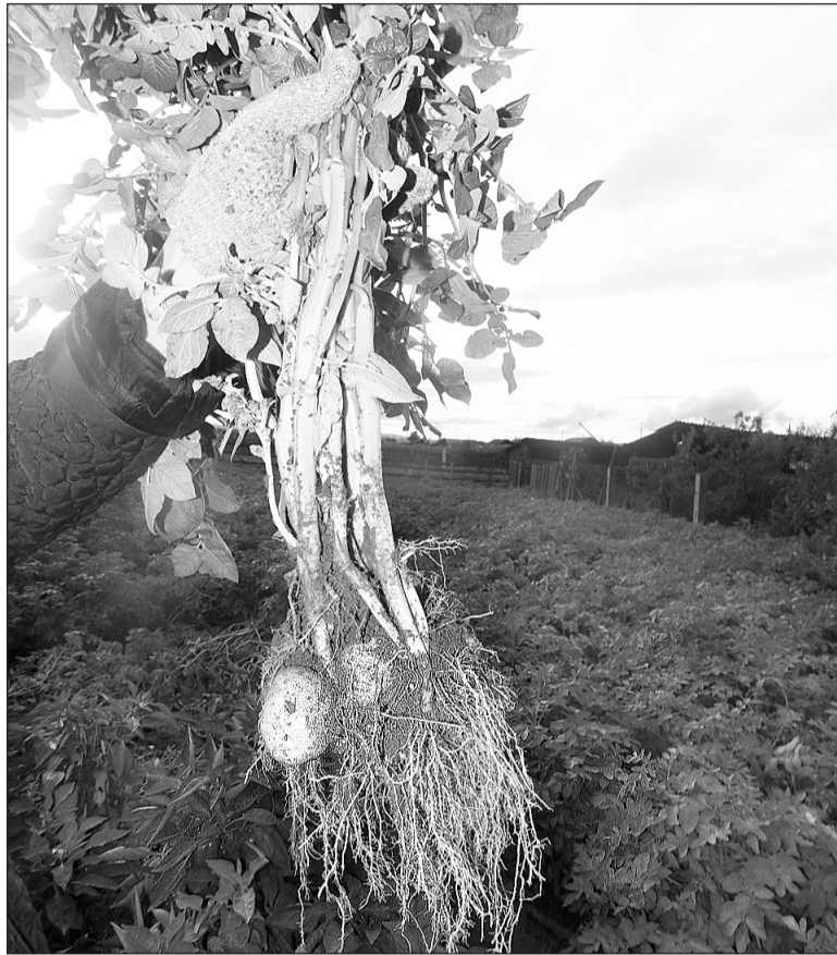
Картофель в этом году не радуется

— Страшная засуха летом сказалась на всём сельском хозяйстве Бурятии. У нас в этом году сложились неблагоприятные погодные условия, которые действуют на всё. Во-первых, это недобор в сенокосе, что-то наросло только в низменных местах. Закладка силоса, как и заготовка сена, в хозяйстве с недобором на 50–80 процентов. Зерновые тоже