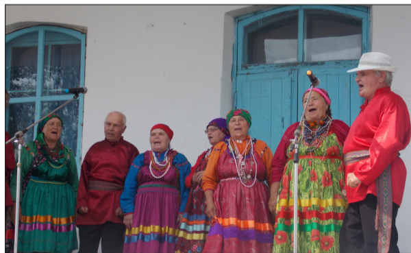
Гордость села — ансамбль «Родники»

Кто хоть раз бывал в Петропавловке, не мог не заметить здание клуба. Оно стоит на пригорке и его видно издалека. Белоснежный, с широким крыльцом, высокими потолками и просторными помещениями — настоящий дворец культуры для жителей небольшого села. К сожалению, таких клубов сегодня в районе осталось немного.