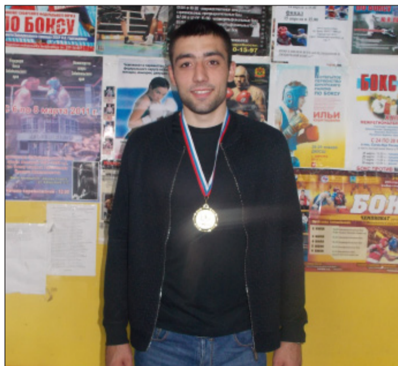
Чемпион в стенах Бичурской ДЮСШ