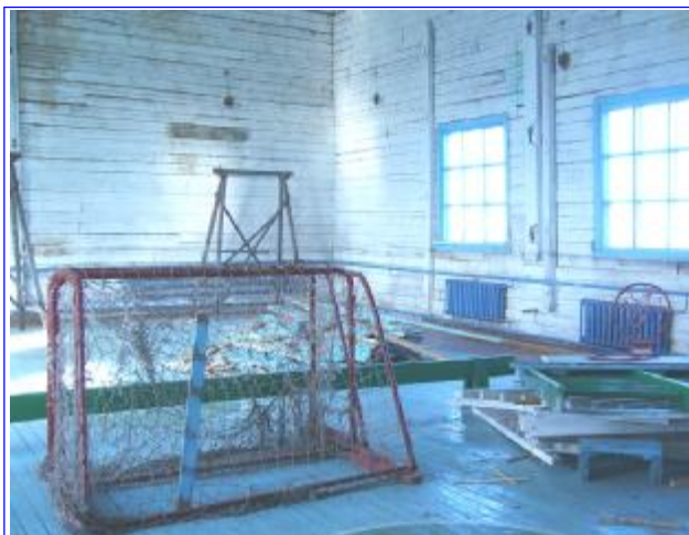
Сегодняшний вид спортзала.

Не понимаю, что за строители работали, посмотрите - стены кривые. Пол делали на мерзлой земле. Теперь шляпки от гвоздей вылезают. Два года у нас в спортзале не было освещения. В этом году крыша начала расходиться. О какой безопасности может идти речь?