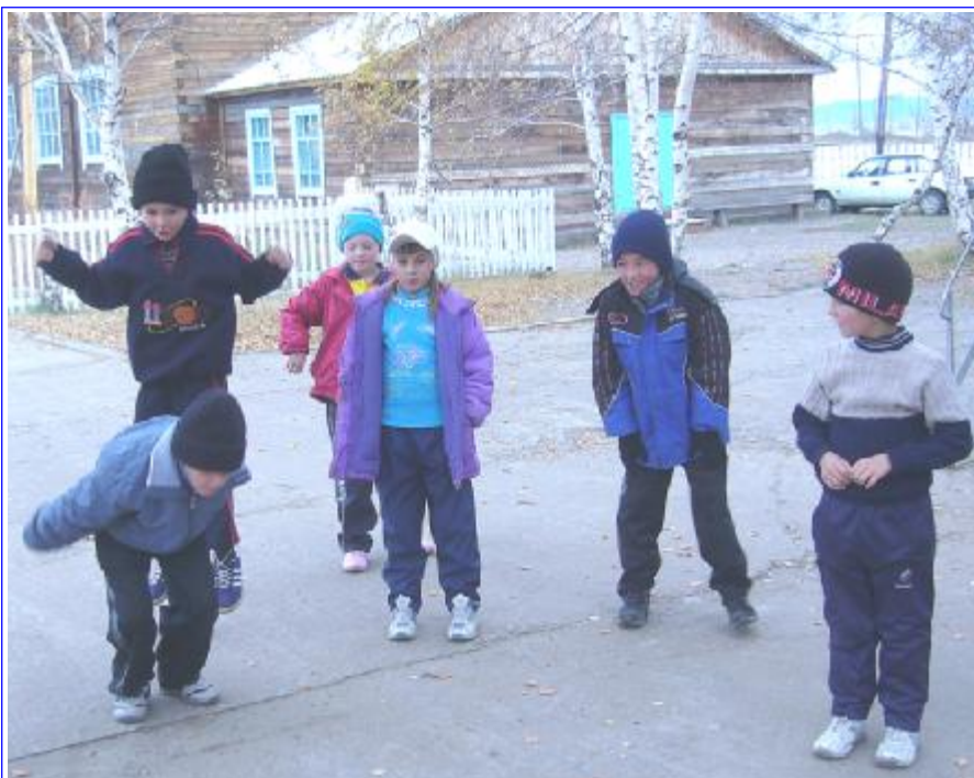
Несмотря на утреннюю, уже минусовую температуру, дети занимаются на улице.

«Распоряжением администрации Бичурского района от 13.02.03 г. № 47р 12 февраля 2003 года было