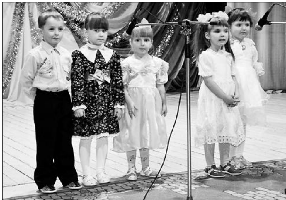
Воспитанники детского сада «Полянка» поют для любимых мам.