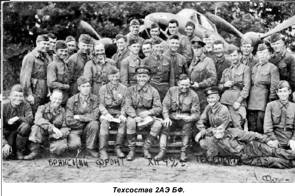
Техсостав 2АЭ БФ.