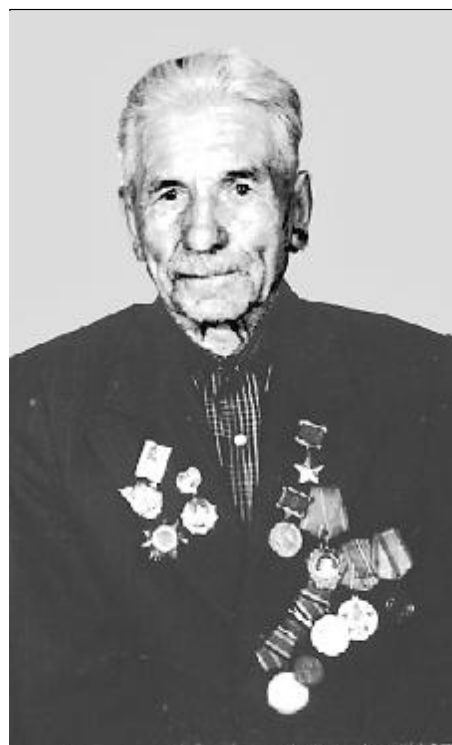
Герой Советского Союза - Соломенников Ефим Иванович.