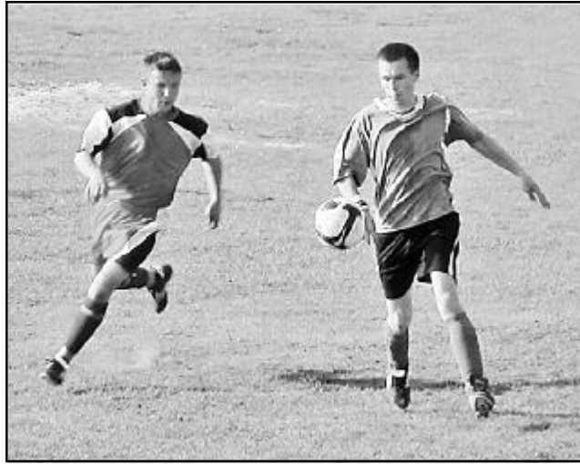
В борьбе за мяч.